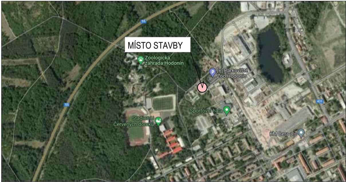
Ortofoto M 1:10000